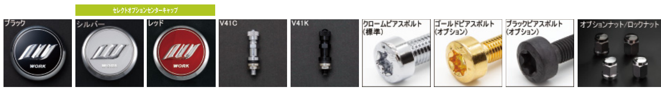
※ナットの詳細について▶P.262